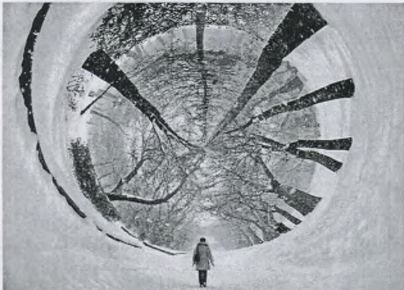
Фото – Евгений Борщенко, ИФ 4.1

Одиннадцать молодых фотографов академии и колледжа примут участие в выставке, организованной Союзом художников ЛНР. Открытие выставки состоится 26 декабря в 11:00 в выставочном зале Союза художников по адресу: ул. Сент-Этьеновская, 40. В качестве анонса представляем вашему вниманию несколько работ.