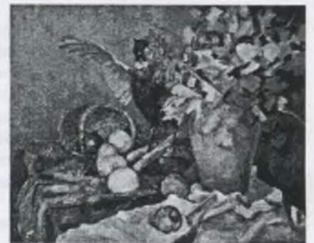
Сирик Валерия ХДЖ-5.